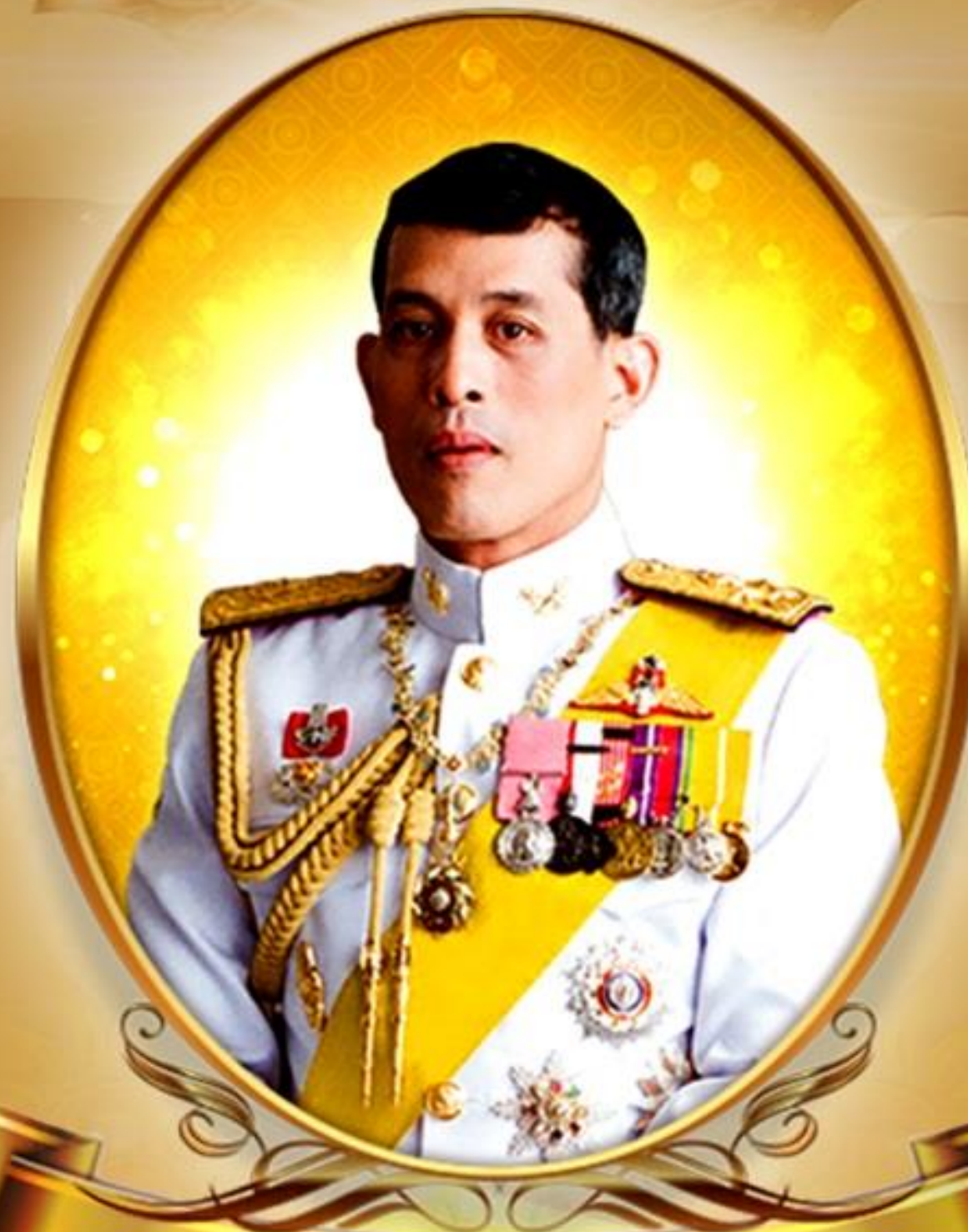
ทรงพระเจริญ