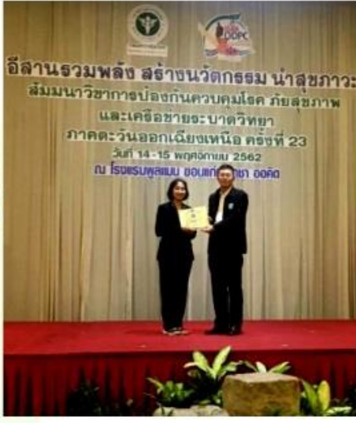
โลรางวัลชนะเลิศ