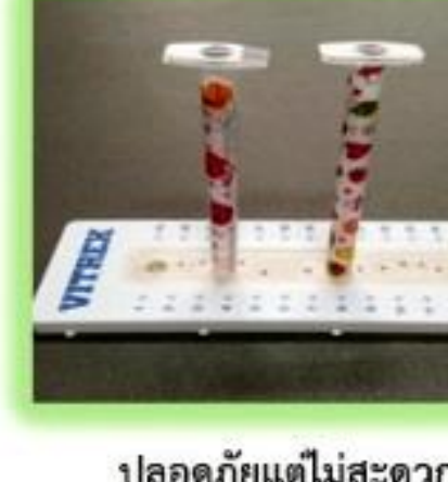
ปลอดภัยแต่ไม่สะดวก