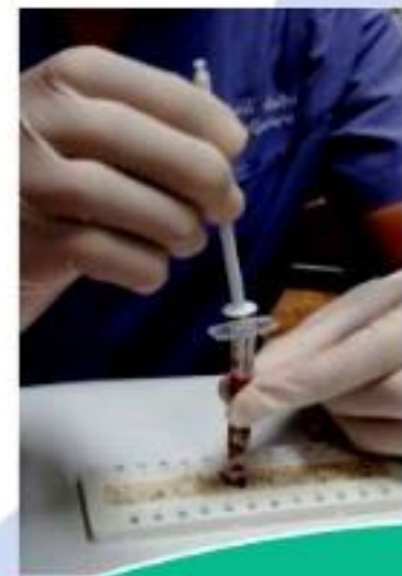
ผลลัพธ์ ปลอดภัย แต่ไม่สะดวก