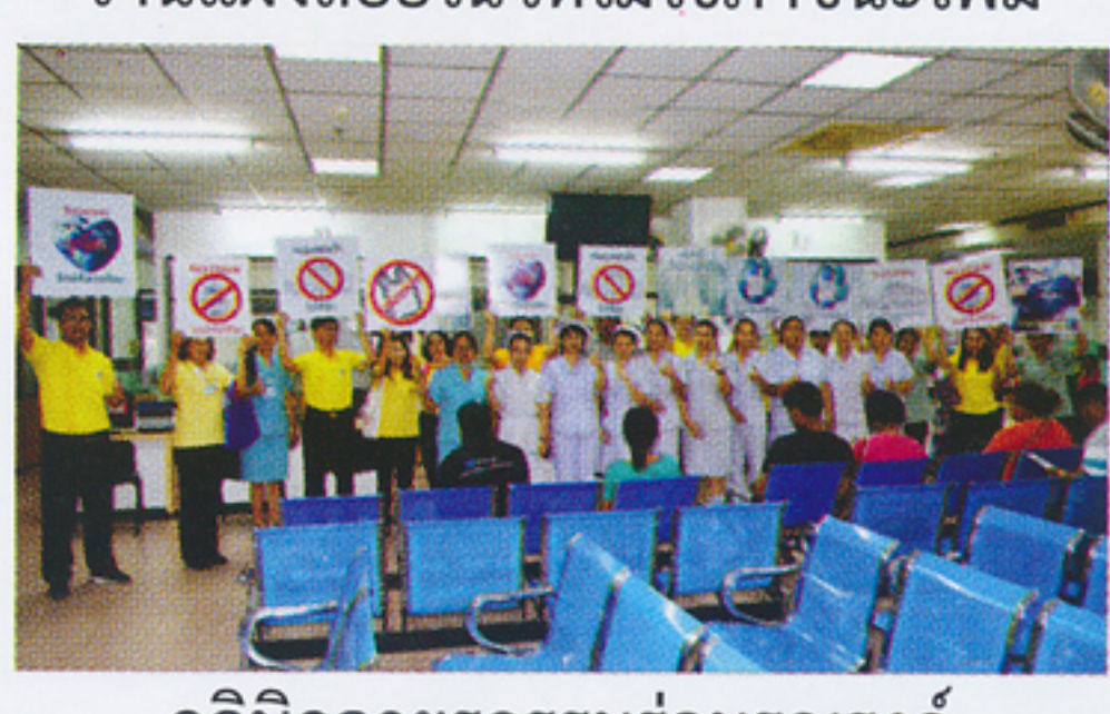
คลินิกอายุรกรรมร่วมรณรงค์