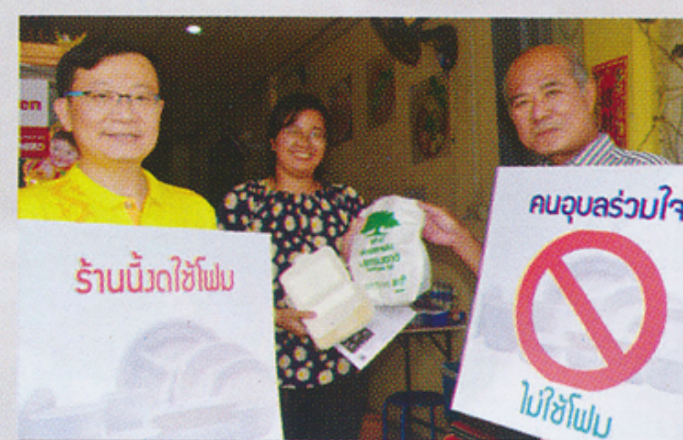
ร้านนิมิตใจ ไม่ใช้ภาชนะโฟม และใช้ถุงหิ้วแบบย่อยสลาย