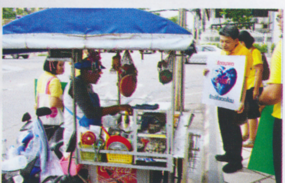
แผงลอยขนมโตเกียว ใช้ถุงกระดาษไร้หมึก