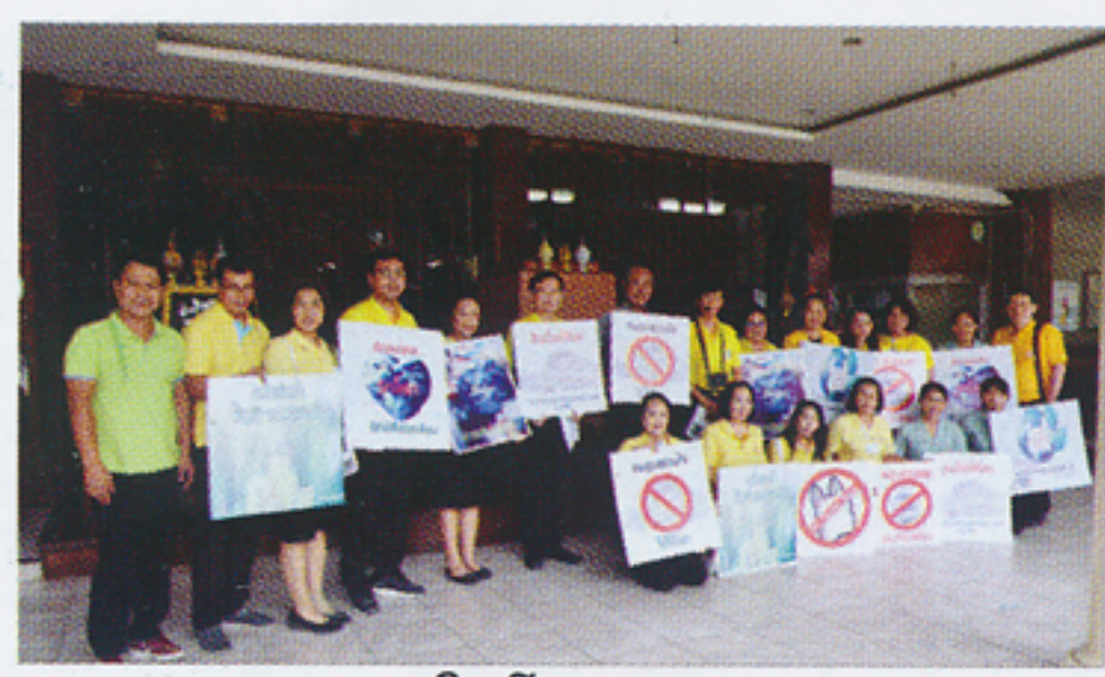
รวมพลในโรงพยาบาล ก่อนออกเดินรณรงค์