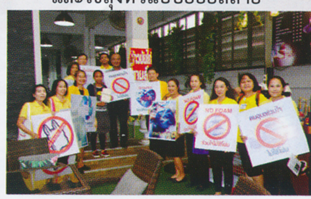
ร้านข้าวมันไก่ไม่ใช้ภาชนะโฟม