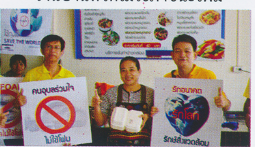
ร้านครัวคุณตุ้งไม่ใช้ภาชนะโฟม