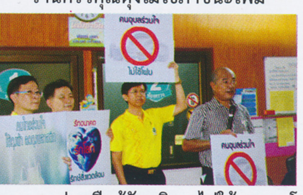
ขอความร่วมมือผู้รับบริการไม่ใช้ภาชนะโฟม