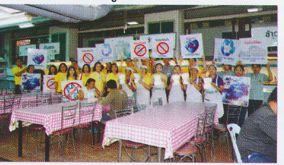
ศูนย์อาหารโรงพยาบาลให้ความร่วมมือ