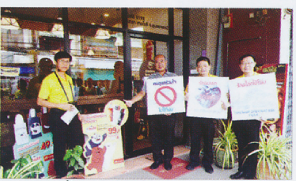
ร้าน we bare bears มีโปรโมชันร่วมลดโลกร้อน