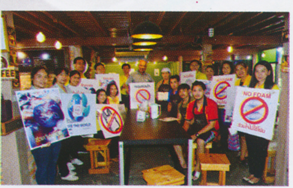
ร้านบ้านทวดไม่ใช้ภาชนะโฟม