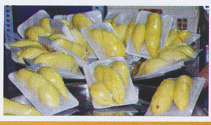
ร้านขายผลไม้รับทุเรียนบรรจุภาชนะโฟมมาขาย โรงพยาบาลขอความร่วมมือร้านผลไม้แจ้งร้าน ส่งเปลี่ยนภาชนะและจะติดตามอีกครั้ง