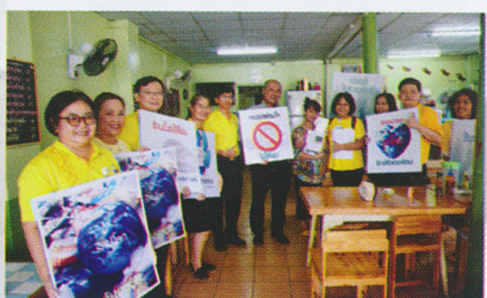
ร้านแป็บซี่ ไม่ใช้ภาชนะโฟม