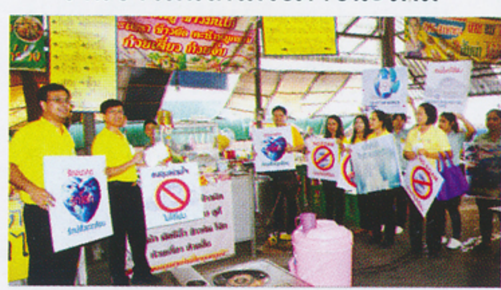
ร้านแผงลอยในวัดไม่ใช้ภาชนะโฟม