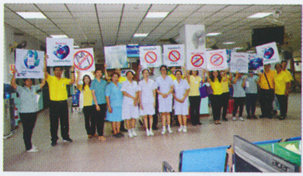
หน่วยตรวจศัลยกรรมร่วมรณรงค์