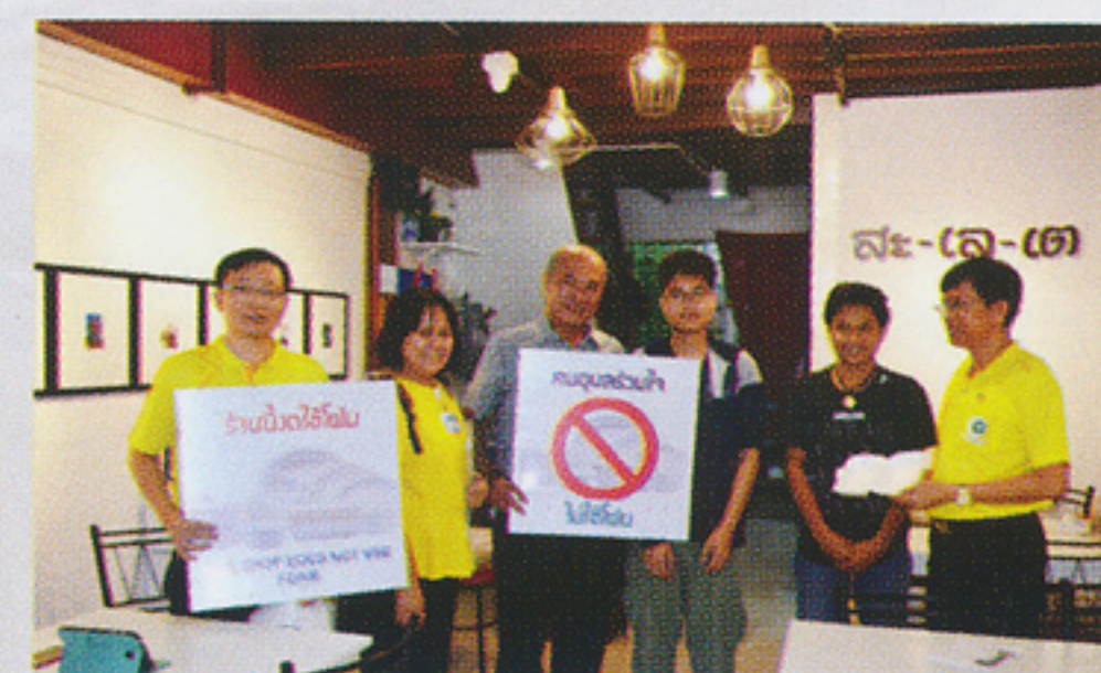
ร้านสะเล-เล-เต ไม่ใช้ภาชนะโฟม

ผลจากการออกติดตามจากการรณรงค์ครั้งนี้พบว่า ร้านอาหารและเครื่องดื่ม ให้ความร่วมมือไม่ใช้ภาชนะโฟม ร้อยละ 95.00 (จำนวน 57 ร้าน) ในส่วนร้านที่ยังมีการใช้ภาชนะโฟม จำนวน 3 ร้าน เนื่องจากคิดว่าภาชนะโฟมมีราคาถูกกว่า และคงรูปอาหารได้ดีกว่าภาชนะที่ไม่ใช้โฟม ทีมงานได้ชี้แจงให้เกิดความเข้าใจ มี 5 ร้านรับสินค้ามาจำหน่ายอีกต่อ ได้แก่ ทูเรียน และขนมจีน ซึ่งโรงพยาบาลจะมีการประสานไปยังแหล่งต้นทางเพื่อขอความร่วมมือต่อไป นอกจากนี้ยังมีร้านอาหารที่เหมาะสมจะเป็นต้นแบบของการไม่ใช้ภาชนะโฟมบรรจุอาหารหลายร้าน โรงพยาบาลจะดำเนินการมอบเกียรติบัตรหรือป้ายร้านต้นแบบให้โดยเร็ว กิจกรรมดังกล่าวจะส่งผลดีต่อสุขภาพบุคลากรของโรงพยาบาลสรรพสิทธิประสงค์และประชาชนผู้บริโภค ที่มาใช้บริการร้านอาหารและเครื่องดื่มทั้งในโรงพยาบาลและรอบๆโรงพยาบาล จำนวนมากทุกวัน เป็นการลดผลกระทบจากสารพิษในโฟมและพลาสติก อีกทั้งเป็นการลดปริมาณขยะที่ไม่สามารถย่อยสลายได้ และส่งผลดีต่อสภาพแวดล้อม ช่วยลดภาวะโลกร้อนด้วย