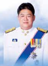
นายวิทยา บุรณศิริ รัฐมนตรีว่าการกระทรวงสาธารณสุข