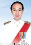
นายแพทย์ไพจิตร วราทิตย์ ปลัดกระทรวงสาธารณสุข

คู่มือการให้บริการคลินิกพิเศษนอกเวลาราชการ Sunpasit Express Clinic Handbook