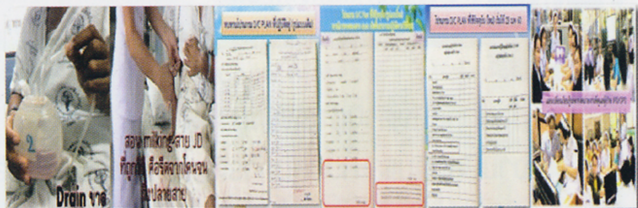
PDCA รอบที่ 3