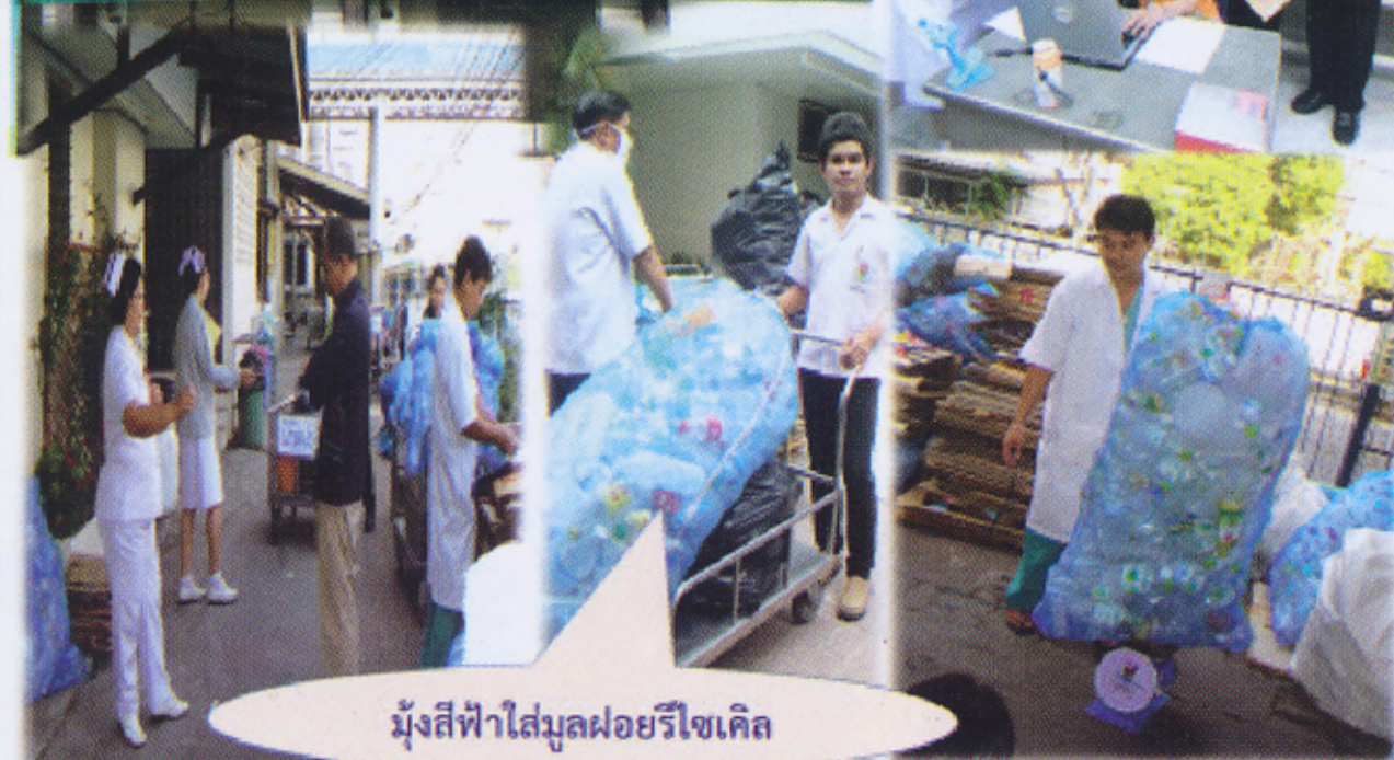
มุ้งสีฟ้าใส่มูลฝอยรีไซเคิล

ธนาคารรีไซเคิล โรงพยาบาลสรรพสิทธิประสงค์