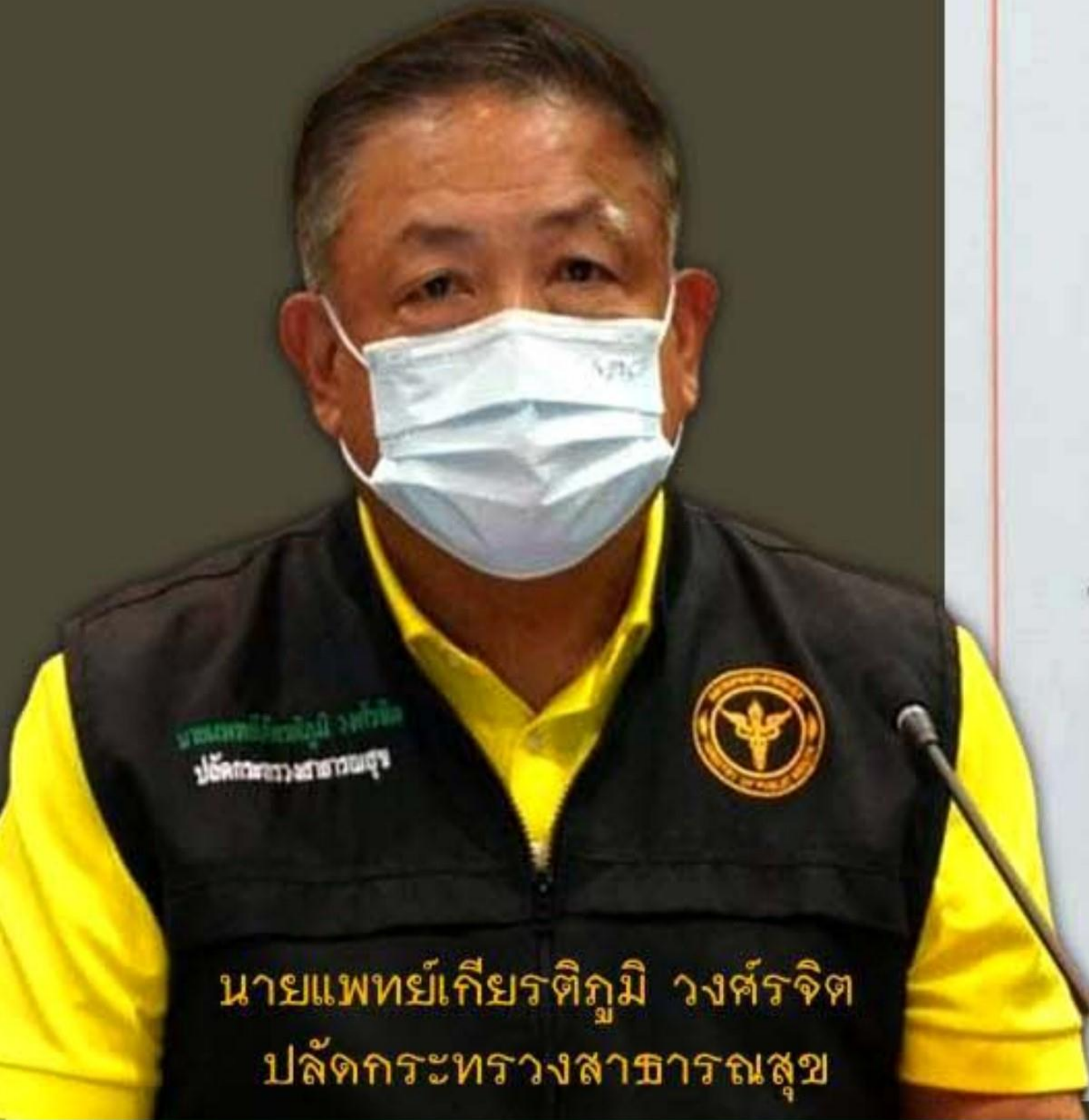
นายแพทย์เกียรติภูมิ วงศ์รจิต ปลัดกระทรวงสาธารณสุข

18 มกราคม 2565 (13.30 น.) ในโอกาส มท. เกียรติภูมิ วงศ์รจิต ปลัดกระทรวงสาธารณสุข และคณะได้มาตรวจเยี่ยม รพ. สรรพสิทธิ์สังเคราะห์ จ. อุบลราชธานี โดยได้รับการต้อนรับเป็นอย่างดีด้วยความอบอุ่นโดย ท่าน ผอ.จ. , ท่าน ผอ.ร. 10. ผู้บริหารและคณะเจ้าหน้าที่โรงพยาบาล 10 และจังหวัดอุบลราชธานี ได้ร่วมฟังการนำเสนอ การดำเนินงานควบคุมป้องกันโรคโควิด-19 ของ รพ. อุบลราชธานี ซึ่งสามารถควบคุมการระบาดได้ดี และมีการจัดบริการให้การรักษาที่มีประสิทธิภาพ ได้มีมอบหมายและแนะนำแนวทางในการควบคุมป้องกันโรคโควิด 19 ขอขอบคุณบุคลากรโรงพยาบาลและผู้ที่เกี่ยวข้องทุกท่าน ที่ช่วยกันปฏิบัติงานกันอย่างเข้มแข็ง ขอให้ทุกท่านประสบความสำเร็จและความเจริญ (รพ. เกียรติภูมิ วงศ์รจิต) ปลัดกระทรวงสาธารณสุข