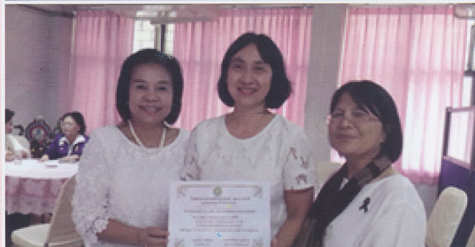
จำนวนผลงานวิจัย โครงการพัฒนางานวิจัย กลุ่มภารกิจด้านการพยาบาลโรงพยาบาลสรรพสิทธิประสงค์