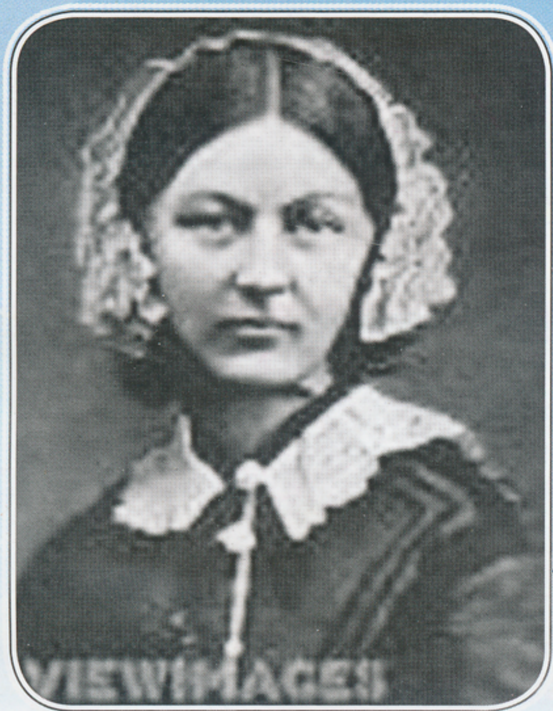
ฟลอเรนซ์ ไนติงเกิล