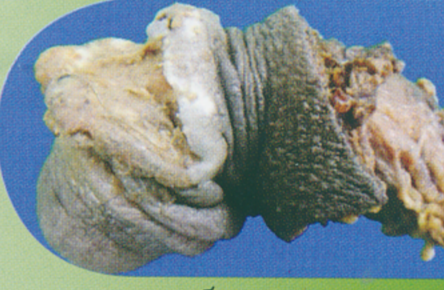
ภาพมะเร็งองคชาต

Disease ปี ค.ศ.2011 อาการของมะเร็งทวารหนักประกอบด้วย การมีเลือดออกจากทวารหนัก ปวด คัน มีสารคัดหลั่งออกมาทางทวารหนักหรือบางรายมีต่อมน้ำเหลืองที่ขาหนีบโตร่วมด้วย ภายในทวารหนักหรือบริเวณอวัยวะเพศและมีการเปลี่ยนแปลงของการขับถ่ายและอุจจาระ จากการตรวจหาเชื้อด้วยเทคนิค PCR พบว่า 6 ใน 10 ของมะเร็งองคชาตมีความเกี่ยวข้องกับของการติดเชื้อ HPV อ้างอิงจากสมาคมโรคมะเร็งแห่งสหรัฐอเมริกา มะเร็งองคชาตจะเริ่มจากการมีเนื้อเยื่อภายในองคชาตเปลี่ยนแปลง เช่น เปลี่ยนสีหรือมีผิวหนังหนาตัวขึ้น และอาจทำให้มีองคชาตโตขึ้นหรือเป็นแผลได้ การตรวจพบเชื้อ HPV ที่องคชาตยังสามารถเป็นพาหะที่สำคัญนำไปสู่การติดเชื้อที่ทวารหนักและอวัยวะสืบพันธุ์สตรีอีกด้วย