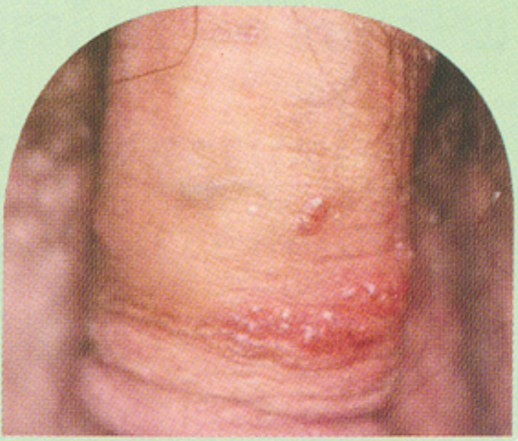
ภาพการเชื้อ HPV ที่องคชาต ลักษณะเป็นก้อนนูน

มีกรณีเชื้อ HPV ประมาณ 75% ที่สามารถทำให้เกิดหูดที่ผิวหนังได้หลายรูปแบบและสามารถติดต่อได้จากการสัมผัส เชื้อ HPV สายพันธุ์อื่นๆ สามารถทำให้เกิดหูดที่อวัยวะเพศได้ โดย 90% ของการเกิดหูดที่อวัยวะเพศเกิดจากเชื้อ HPV สายพันธุ์ 6 และ 11 การเกิดหูดที่อวัยวะเพศหรือองคชาตในผู้ชายสามารถเกิดตามหลังจากการติดเชื้อได้หลายสัปดาห์หรือหลายเดือนโดยสามารถโตได้ทั้งภายในและรอบๆ องคชาต ทวารหนัก ต้นขาด้านบน บริเวณขาหนีบ และอวัยวะ และด้านในของรูเปิดท่อปัสสาวะ หูดที่อวัยวะอาจจะมีขนาดเล็กลงกว่าที่จะมองเห็นได้เรียบหรือยกนูนก็ได้มีลักษณะคล้ายดอกกะหล่ำ(เมื่อโตรวมกันเป็นกลุ่มๆ) ปวด เจ็บ หรือคัน หากหูดเกิดที่บริเวณรูเปิดปัสสาวะอาจทำให้เกิดการปัสสาวะผิดปกติและเลือดออกจากท่อปัสสาวะได้