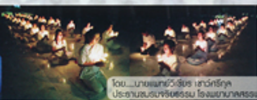
โคม...บายแนบ...วิชัย...เสนา... ประธานชมรมจริยธรรม โรงเรียนบดินทรเดชาอัครราชวิทยาลัย