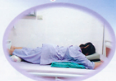
หลักการและเหตุผล