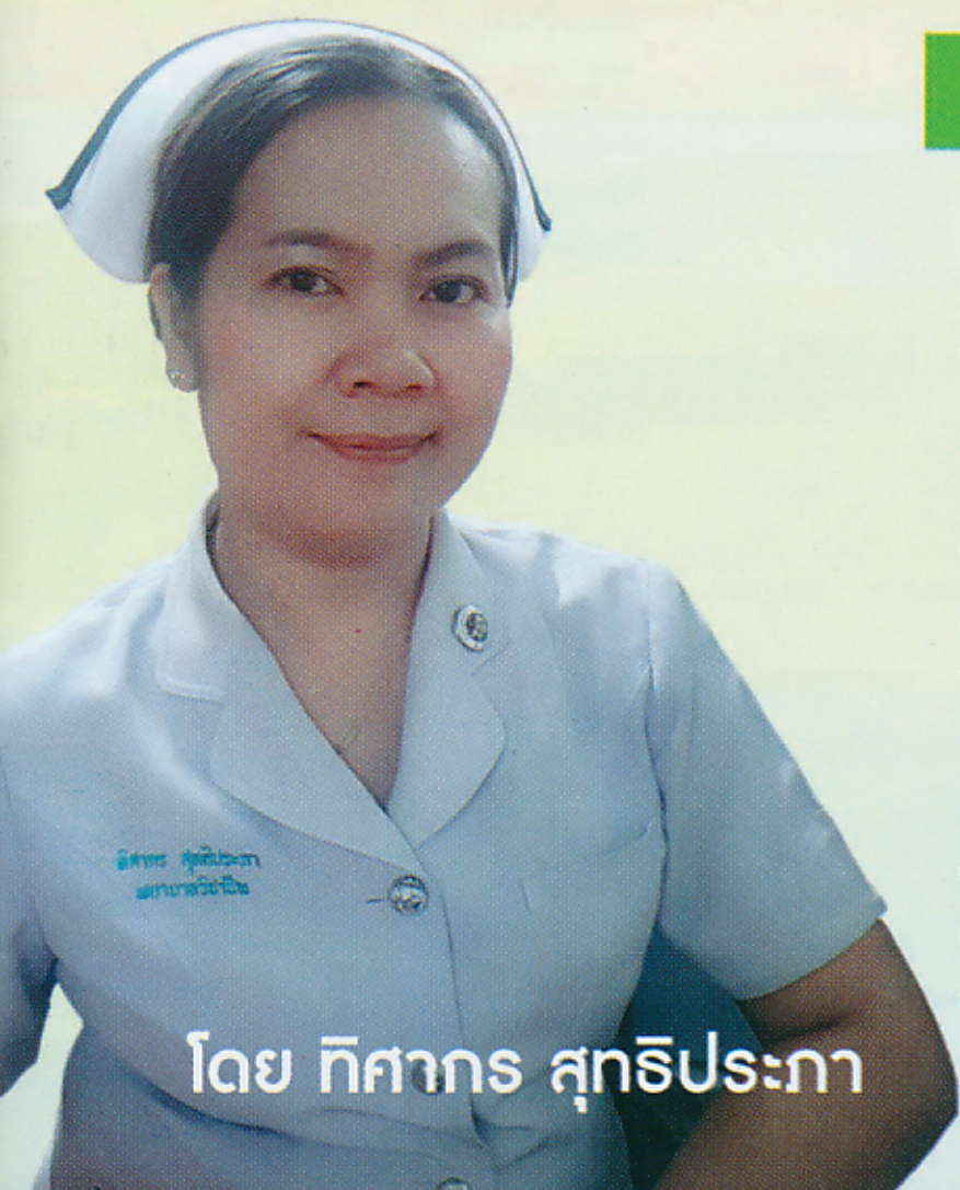
โดย ทิศากร สุทธิประภา

การผ่าตัดลิ้นหัวใจ เป็นการผ่าตัดที่มีความยุ่งยาก ซับซ้อน หลังผ่าตัดมีโอกาสเกิดภาวะแทรกซ้อนสูง ทั้งในระยะแรกและหลังผ่าตัดผู้ป่วยส่วนใหญ่ร้อยละ 90 ต้องรับประทานยาต้านการแข็งตัวของเลือด และได้รับการติดตามการรักษาในคลินิกการฟาริน ก่อนส่งต่อไปยังโรงพยาบาลใกล้บ้านหรือเครือข่ายการฟารินส่วนภาวะแทรกซ้อนระยะยาวหลังผ่าตัด เช่น Valve ส่งผลกระทบต่อผู้ป่วย ด้านร่างกาย จิตใจ สังคมและเศรษฐกิจ จำเป็นต้องมีการวางแผนการจำหน่ายและการดูแลต่อเนื่อง จากการศึกษาพบว่าผู้ป่วยกลับมารักษาซ้ำเกิดจาก การปฏิบัติตัวไม่ถูกต้อง การรับประทานยา warfarin และ warfarin overdose จากสถิติผู้ป่วยที่เข้ารับบริการผ่าตัดเปลี่ยนลิ้นหัวใจชนิดโลหะหน่วยงานศัลยกรรมหัวใจและทรวงอก โรงพยาบาลสรรพสิทธิประสงค์ อุบลราชธานี ในปี พ.ศ. 2558, 2559 และ 2560 ในช่วง 3 ปี คือ 181, 197 และ 174 รายตามลำดับ มีผู้ป่วยภาวะลิ้นหัวใจติดจากลิ้นเลือดอุดตัน (Valve dysfunction) จำนวน 3, 5 และ 9 ราย ตามลำดับ คิดเป็นร้อยละ 1.66, 3.05 และ 5.17 การเกิด Bleeding event (ทั้ง Major, Minor และจาก Target INR) ขณะรับประทานยา Warfarin จำนวน 4, 1 และ 3 รายตามลำดับ คิดเป็นร้อยละ 2.21, 0.51 และ 1.72 และผู้ป่วยภาวะลิ้นหัวใจติดจากลิ้นเลือดอุดตันเสียชีวิตจำนวน 0, 0 และ 2 รายตามลำดับ คิดเป็นร้อยละ 0.00, 0.00 และ 1.0 ดังนั้นผู้วิจัยจึงได้นำแนวคิดการจัดการตนเองมา ประยุกต์เป็นโปรแกรมการจัดการตนเองในดูแลต่อเนื่องผู้ป่วยหลังผ่าตัดเปลี่ยนลิ้นหัวใจที่รับประทานยาต้านการแข็งตัวของเลือด