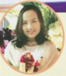
โดย..วีระนุช มยุเรศ