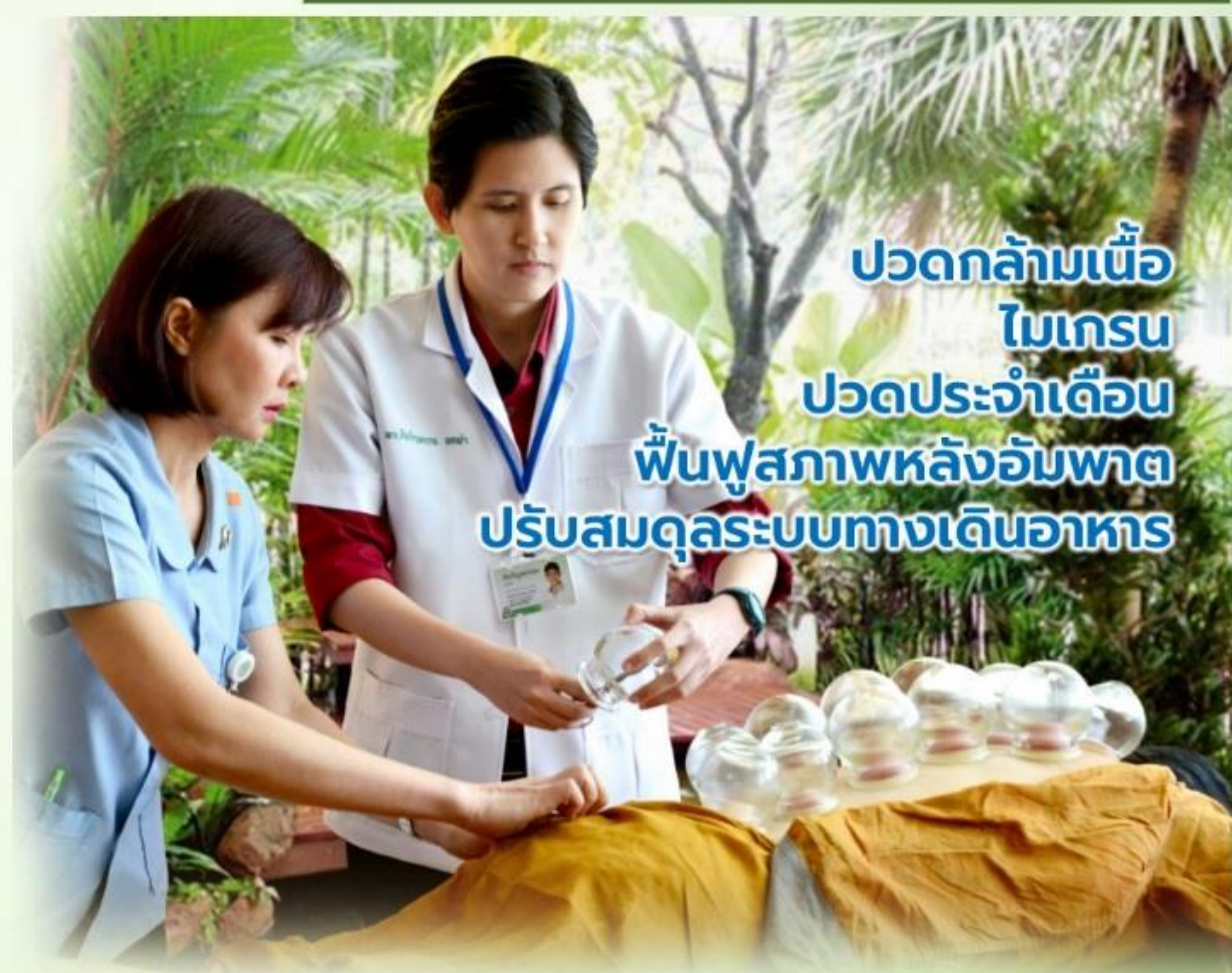
ปวดกล้ามเนื้อ ไมเกรน ปวดประจำเดือน ฟื้นฟูสุขภาพหลังอัมพาต ปรับสมดุลระบบทางเดินอาหาร

นอกจากนี้เรายังมีบริการฝังเข็มแผนจีน ซึ่งองค์การอนามัยโลก (WHO) ได้ประกาศยอมรับการรักษาโรคและบรรเทาอาการด้วยวิธีฝังเข็ม พร้อมยืนยันการรักษาที่ได้ผลเด่นชัดหลายกลุ่มอาการ เช่นกลุ่มอาการปวด ภูมิแพ้ กรดไหลย้อน อัมพฤกษ์ อัมพาต และฝังเข็มเพื่อความงาม เป็นต้น ปัจจุบันเรามีบุคลากรเชี่ยวชาญเฉพาะการฝังเข็มที่เป็นแพทย์แผนปัจจุบัน ผ่านการอบรมฝังเข็มและแพทย์แผนจีนประจำหน่วยบริการคลินิก การแพทย์แผนไทยและการแพทย์ทางเลือก บริการทุกวันจันทร์-ศุกร์ 08.00-16.00น.และนอกเวลาราชการ ( พุธ พุธที่สวด 16.00-18.00น ) และ ( วันเสาร์ 08.00 - 16.00น. ) ที่อาคารผู้ป่วยนอก ชั้น 3 นอกจากนี้ ยังมีบริการนอกสถานที่ คือที่คลินิกหมอครอบครัวท่าวังหิน ชยางกูร และคลินิกพิเศษโรงพยาบาลสรรพสิทธิประสงค์อุบลสแควร์