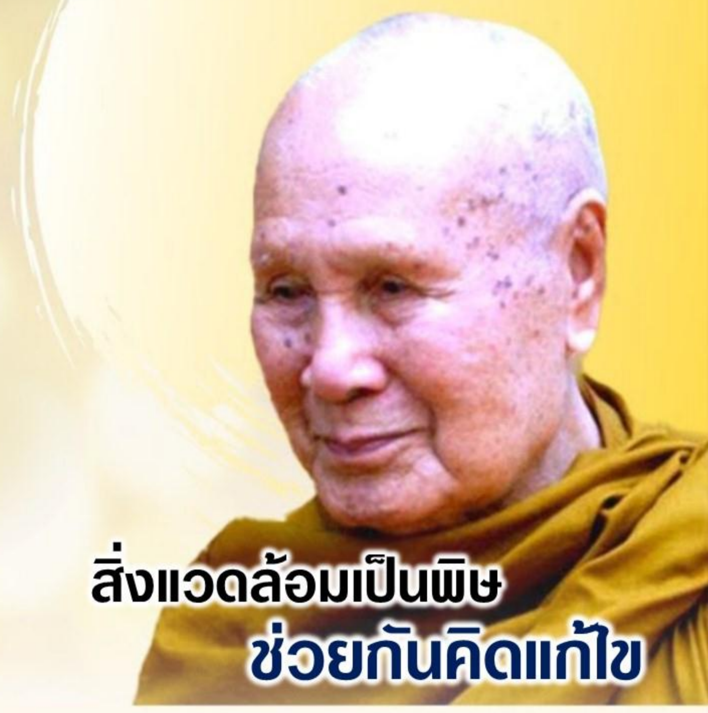
สิ่งแวดล้อมเป็นพิษ ช่วยกันคิดแก้ไข ทลวงพ่อปัญญานันทะ กิกฺขุ