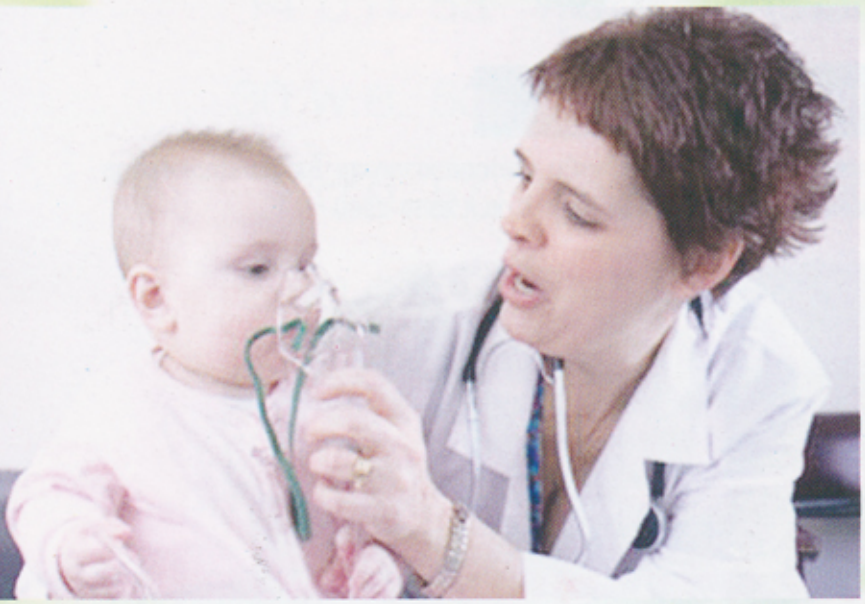
ที่มาของภาพ : http://www.vibhavadi.com