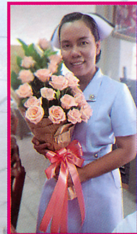
เตือนใจ วงษ์กระจ่าง

และลดการตีตราและเลือกปฏิบัติต่อผู้มีเชื้อเอชไอวี ร้อยละ 90 การตีตราและการเลือกปฏิบัติเป็นอันตรายจากเหง้าทำให้เกิดผลกระทบที่ไม่พึงประสงค์ต่อคุณภาพของบริการสุขภาพ การถูกรังเกียจกีดกันจากการใช้หรือการได้รับบริการสุขภาพด้านต่าง ๆ อย่างไม่เต็มคุณค่า ส่งผลให้ผู้ที่รู้ว่ามีเชื้อเอชไอวีไม่กล้าไปรับบริการสุขภาพที่สำเนา คุณภาพชีวิตต่ำลง ดังนั้น หากจะมุ่งยุติปัญหาเอดส์ให้ได้จำเป็นต้องเร่งรัดและร่วมกันขยาย การดำเนินงานเพื่อลดการตีตราและการเลือกปฏิบัติฯ ควบคู่ไปกับมาตรการหลักในการป้องกันและดูแลรักษาเพื่อรองรับนโยบาย “การรู้เร็ว รักษาเร็ว” ดังนั้น กลุ่มภารกิจด้านการพยาบาล โรงพยาบาลสรรพสิทธิประสงค์ จึงได้จัดทำโครงการขึ้นเพื่อสำรวจและประเมินทัศนคติเกี่ยวกับการตีตราและเลือกปฏิบัติ รวมทั้งสร้างความรู้ ความเข้าใจที่ถูกต้องเรื่องโรคเอดส์ ส่งเสริมการอยู่ร่วมกันกับผู้อยู่กับเชื้อเอชไอวี/ผู้ป่วยเอดส์ และเพื่อสร้างความร่วมมือในการพัฒนาคุณภาพบริการลดการตีตราและการเลือกปฏิบัติที่เกี่ยวข้องกับเอชไอวี/เอดส์ในสถานบริการสุขภาพ ประโยชน์ที่จะได้รับจากการดำเนินโครงการบุคลากรมีความเข้าใจที่ถูกต้องเกี่ยวกับโรคเอดส์ พฤติกรรมเสี่ยงต่อการติดเชื้อเอชไอวี วิธีการป้องกันที่ถูกต้องและเหมาะสมเพื่อลดความกังวลกลัวการติดเชื้อเอชไอวี ผลกระทบที่เกิดจากความคิด ความเชื่อ เพื่อลดการตีตราและการเลือกปฏิบัติที่เกี่ยวข้องกับเอชไอวี การให้คำแนะนำแก่ผู้รับบริการอย่างถูกต้อง เลกเปลี่ยนความรู้อะหว่างหน่วยงานเพื่อนำมาสู่การพัฒนาการพยาบาลให้ครอบคลุมทั้งด้านร่างกายและจิตใจ ทราบแนวทางการให้บริการดูแลผู้ติดเชื้อเอชไอวีเพื่อให้บริการตามมาตรฐาน และร่วมกันกำหนดแนวปฏิบัติในการป้องกันการตีตราและการเลือกปฏิบัติที่เกี่ยวข้องกับเอชไอวีและเอดส์