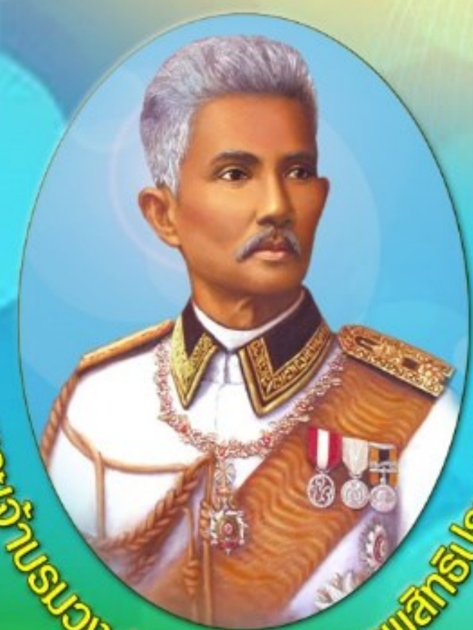
พระเจ้าบรมวงศ์ กรมหลวงสรรพสิทธิประสงค์

จุลสาร สรรพสิทธิสัมพันธ์ Sunpasitsumpun bulletin