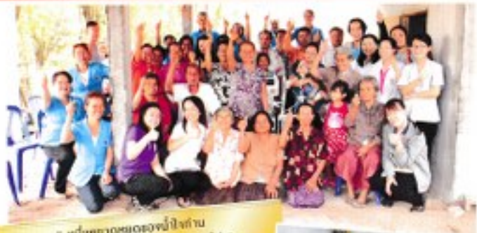
"หนึ่งทางของใจของปีใจกัน ช่วยต่อลมหายใจเด็กป่วยในดงอยู่ต่อไป แล้วเจอกันครับ"

มูลนิธิร่วมสามสหาย มูลนิธิร่วมสามสหาย เลขที่ 100 ถนนวิภาวดีรังสิต แขวงสามเสนนอก เขตห้วยขวาง กรุงเทพฯ 10310 โทรศัพท์ 02-262-0000 โทรสาร 02-262-0001 www.jom-sam-sa-hai.com