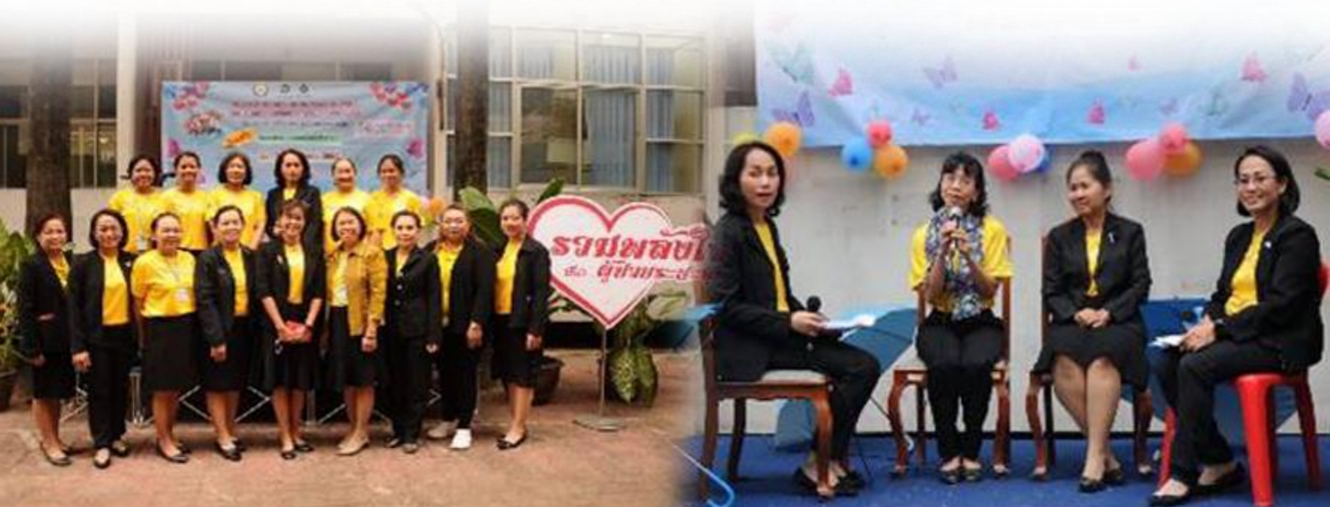
เสวนา " ขอเพียงได้ดูแลชีวิต ตามสิทธิ์ของตัวเอง "

สำหรับประชาชนทั่วไปที่สนใจ www.thailivingwill.in.th , facebook:สุขปลายทาง