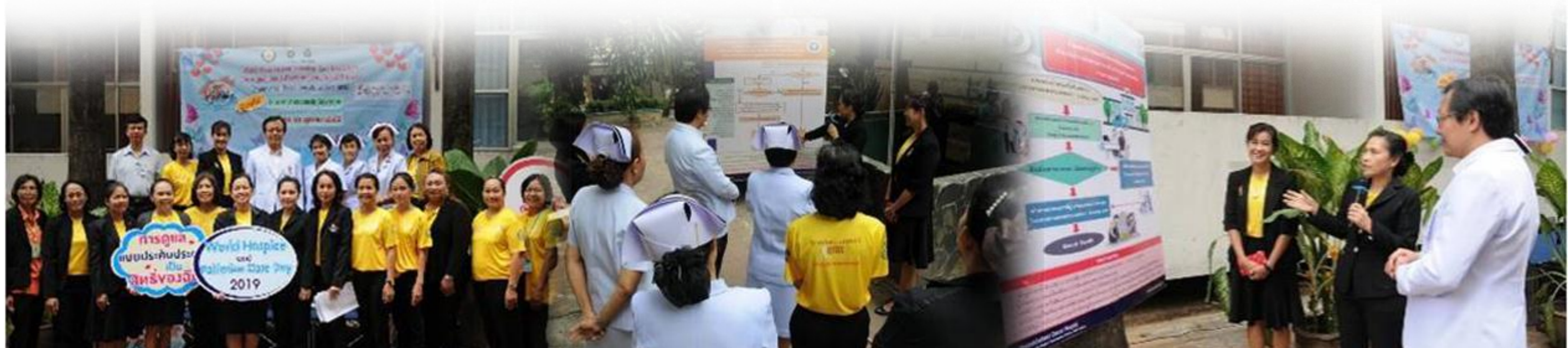
บูท "ชีวิตออกแบบได้กับการเขียนพินัยกรรมชีวิตอย่างง่าย " โดย ทีม Palliative care sw.